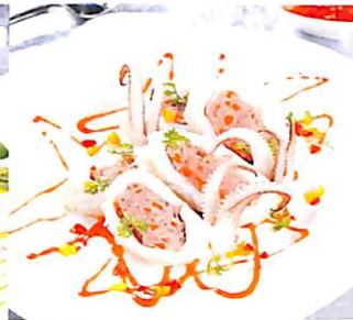
050 ปลาหมึกอบ