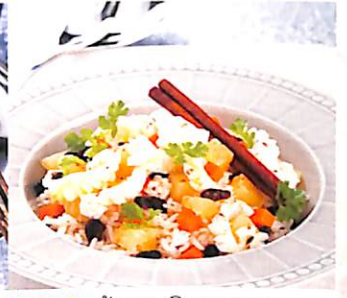
020 ข้าวอบจีนนามอน