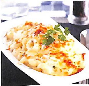
022 มะกะโรนี อบซอสเห็ด