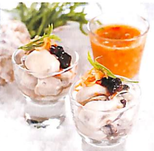
104 หอยนางรม ทรงเครื่อง