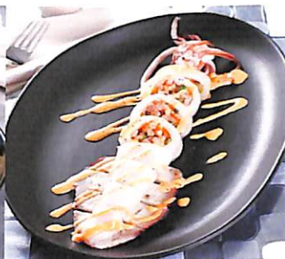
044 ปลาหมึกนึ่งสอได้