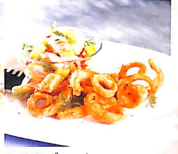
036 ยำมะม่วง ปลาหมึกสามรส