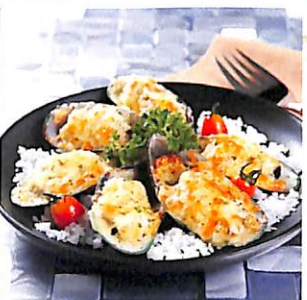
116 หอยแมลงภู่อบชีส