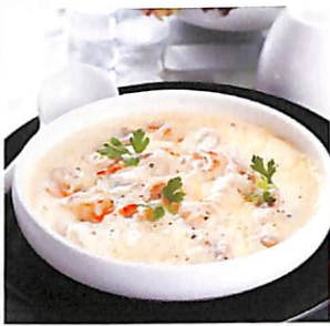
062 ทะเลครีมซอส