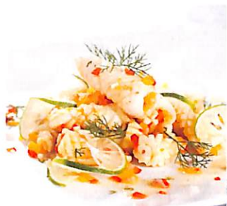
038 ปลาหมึก หมึกซอสมัสตาร์ด