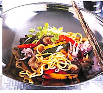
018 ไช้บะผักย่าง