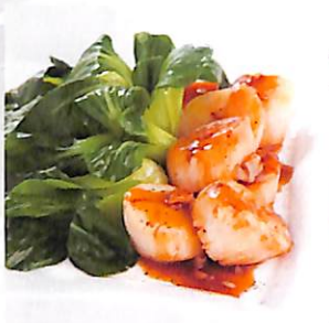
082 หอยเชลล์เจียน