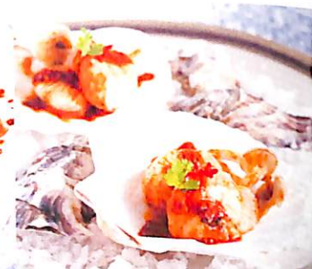
096 หอยเชลล์ต้มยำแห้ง