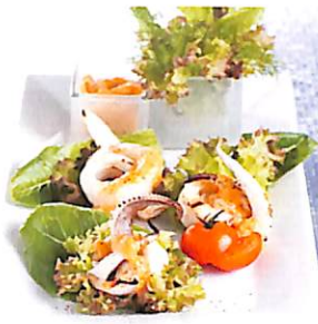
040 ปลาหมึกย่างซอส มายองเนสกระเทียม