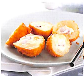
054 โครเกตต์ปลาหมึก