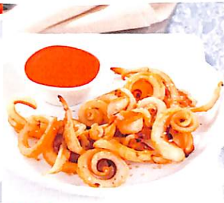
052 ปลาหมึกแดดเดียว