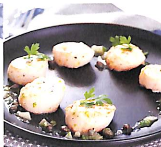
086 หอยเชลล์อบเนย