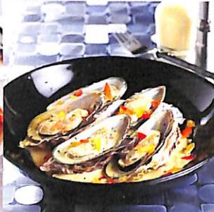
092 หอยแมลงภู่ อบผงกะหรี่