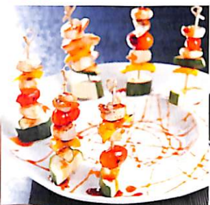
114 บาร์บีคิวหอยเชลล์