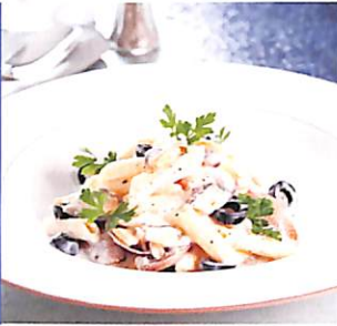
076 เพนเน่หอยลาย