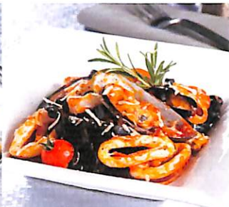
060 สปาเกตตีเส้นหมึก ผัดทะเล