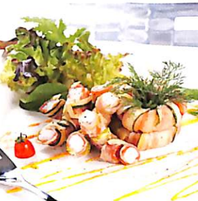
048 เบคอนพันปลาหมึก