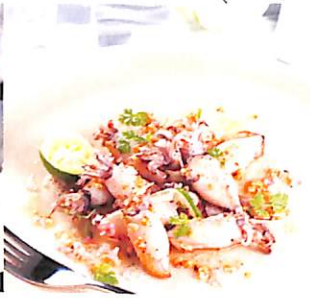
024 ปลาหมึกย่าง ซอสมะนาว