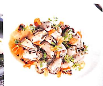
088 หอยนางรม ทอดกระเทียมพริกไทย