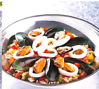
058 ข้าวผัดสมุนไพโร