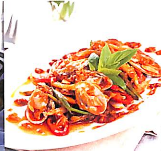
094 หอยลาย ผัดน้ำพริกเผา