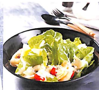
042 ซีซาร์สลัดปลาหมึก