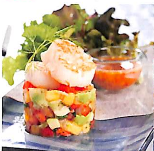
106 ยำอะโวคาโด หอยเชลล์