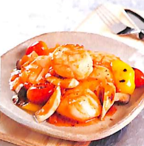
090 หอยเชลล์ ผัดเปรี้ยวหวาน