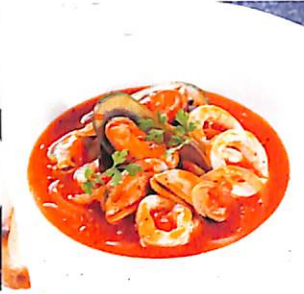
064 ซุปอิตาเลียน