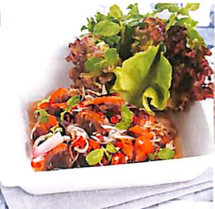
102 ยำหอยครง