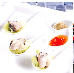
110 ยำหอยนางรมวาซาบิ