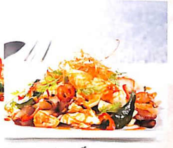
028 ปลาหมึก ผัดพริกเผาต้มยำ