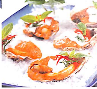
066 ห่อหมกรวมมิตร