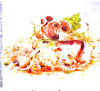
034 ยำปลาหมึก