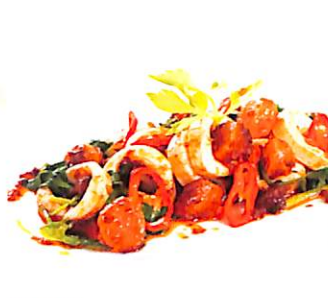
026 ปลาหมึก ผัดไข่เค็ม