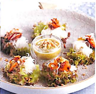
108 เมี่ยงหอยแครง