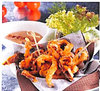
046 ปลาหมึกทอด ซอสค็อกเทล