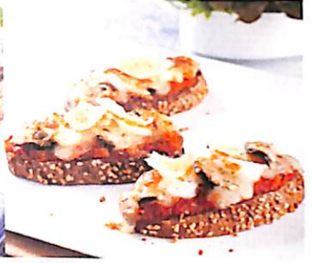
068 มินิพิซซ่าหน้าทะเล