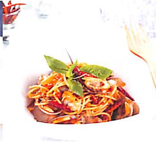
078 สปาเกตตี้หอยลาย ผักพริกเผา