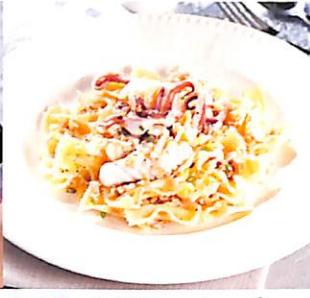
016 พาร์ฟาลเลปลาหมึก