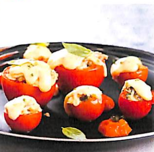
112 มะเขือเทศ ไส้หอยลายอบชีส