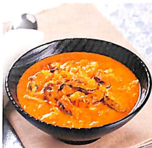
098 แกงคั่วลิบประด หอยแมลงภู่