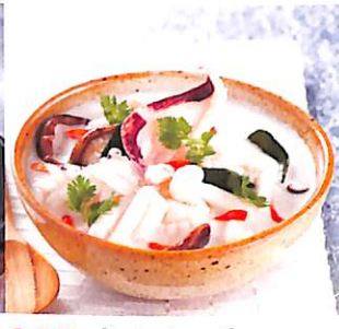
032 ต้มขาปลาหมึก กับเห็ดหิมะ