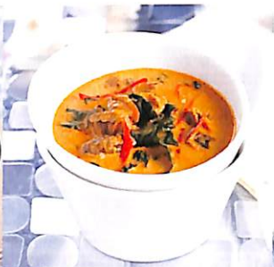
100 แกงคั่วหอยแครง ใบชะพลู