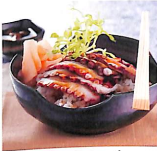
014 ข้าวหน้าปลาหมึก ซอสขิง