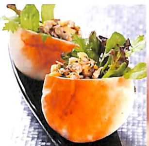
118 ขนมปังพิตต้าไส้หอยลาย ผักกระเทียม