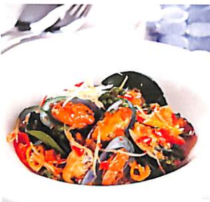
084 หอยแมลงภู่ผัดซ่า