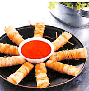
056 ปลาหมึกพันเส้นหมี่