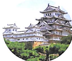
Himeji Castle 姫路城