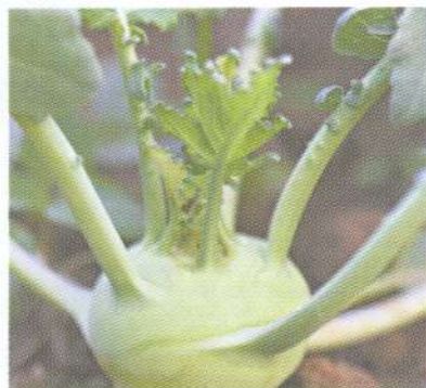
กะหล่ำปม kohlrabi