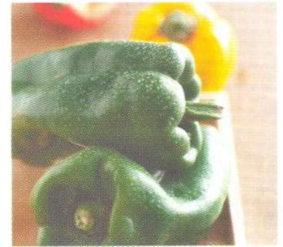
พริกหวาน sweet pepper