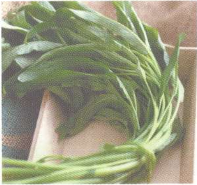
ผักบุ้งจีน