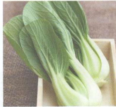
กวางตุ้งไต้หวัน