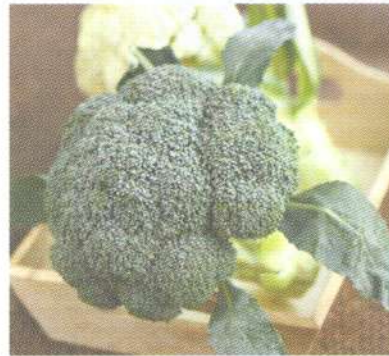
บร็อกโคลี sprouting broccoli