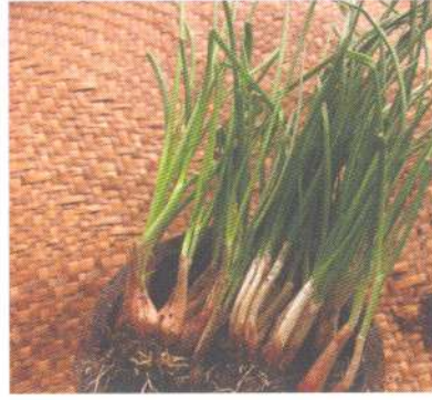
ต้นหอม welsh onion