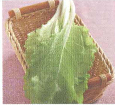
กวางตุ้ง