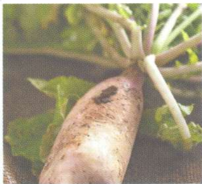
หัวไชเท้า white radish