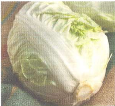
ผักกาดขาวปลี Chinese cabbage