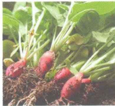
หัวไชเท้าสีแดง cherry belle radish