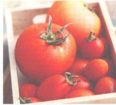
มะเขือเทศ tomato