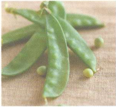
ถั่วลันเตา garden pea