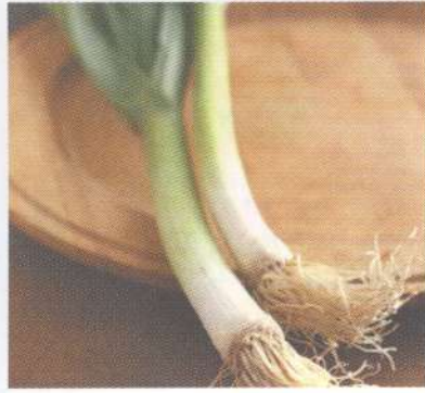
กระเทียม garlic