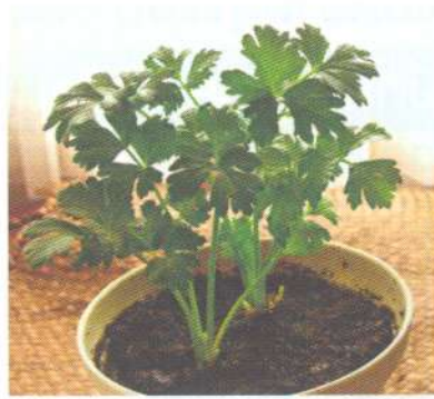
ซีลนฉ่าย celery