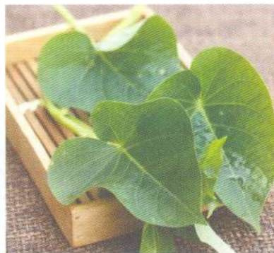
ใบมันเทศ sweet potato vine