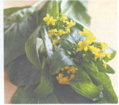
คะน้าจีน