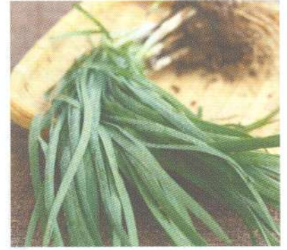
กุยช่าย Chinese chive