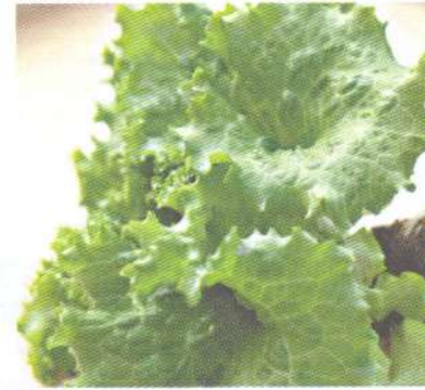
ผักกาดหอม